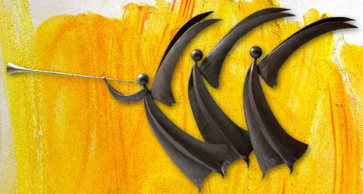
Sculpture de Jean-Pierre AUGIER, Bex, 2010